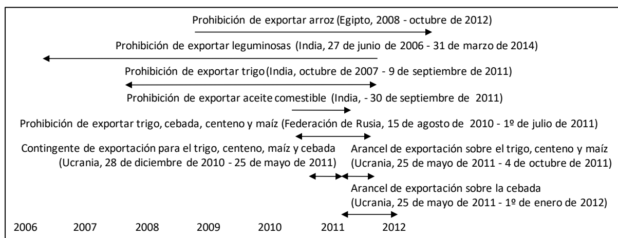
Gráfico 2. Restricciones a la exportación de entre casi un año y más de un año de duración

2.5. Las restricciones cuantitativas a la exportación también deben notificarse al Comité de Acceso a los Mercados. 5 De todas las restricciones cuantitativas notificadas hasta la fecha (las adoptadas en virtud del párrafo 2 a) del artículo XI del GATT en relación con productos agropecuarios se resumen en el cuadro 3), ninguna ha sido objeto de una notificación del cuadro ER.1.